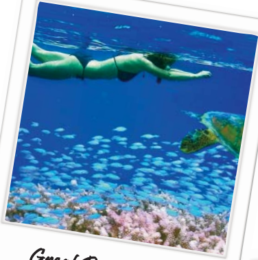
Great Barrier Reef

Abholung der Gruppe durch unseren Guide am Flughafen. Er bringt uns zur Jugendherberge, die für die nächsten Tage unser Quartier sein wird. Danach erkunden wir die Stadt und haben Gelegenheit zum Baden.