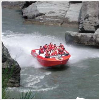
Shotover – Jet