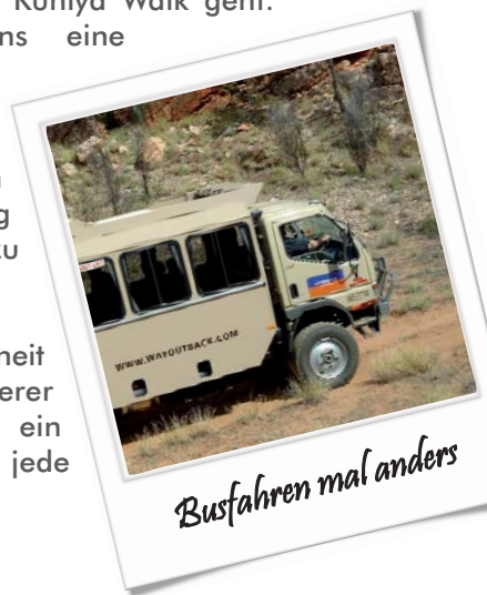
Busfahren mal anders

Buchung und weitere Informationen ausschließlich unter www.studenttours.info